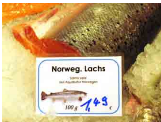
Abb. 3: Kennzeichnungsbeispiel Fischtheke