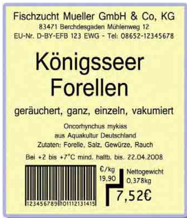
Abb. 2: Kennzeichnungsbeispiel für vorverpackte Ware (Fertigpackung)